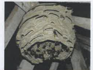
Nid de frelon européen 30 cm, large ouverture vers le bas