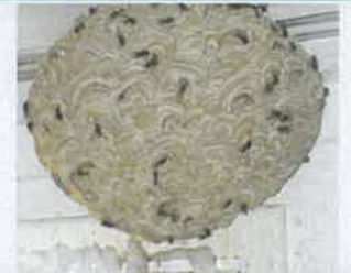
Nid de guêpe 30 cm, petite ouverture vers le bas

Groupement de Défense Sanitaire de l'Eure