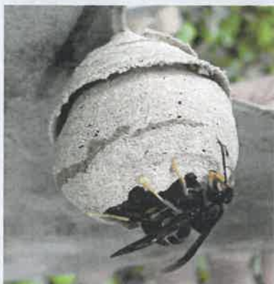
Nid primaire sphériques, 10 cm, endroit abrité

reconnaître un nid de frelon asiatique parmi d'autres nids