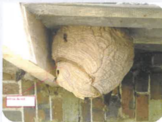
Nid secondaire Sphérique à piriforme Environ 70 cm de diamètre Petite ouverture latérale Arbres, à plus de 10 m (75 % des cas)