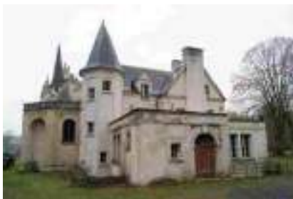
La façade Est du château

Situé sur la rive nord de la Seine, le domaine possède un magnifique parc arboré qui forme un écran autour du château. Un superbe cône de vue vers le Sud-Ouest, permet d'apprécier le fleuve et son paysage jusqu'aux coteaux boisés de Saint-Pierre d'Autil et de Saint-Just.