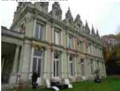
La façade sud vers la Seine