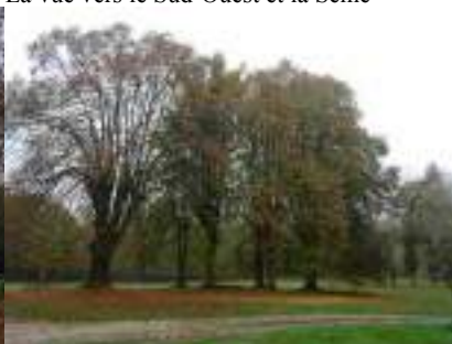
Le parc arboré