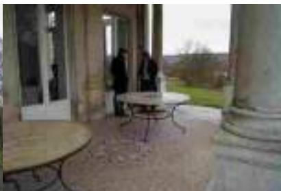
La terrasse vers l'Ouest