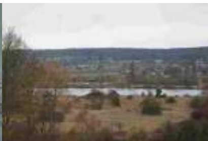
La vue vers le Sud-Ouest et la Seine