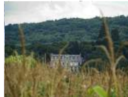
Le château vu de Saint Pierre d'Autils